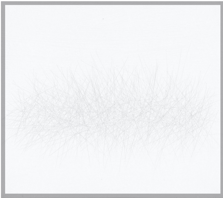
No.I,3_09/ 2009 / 35x40/ Graphite on canvas

彼女の作品との出会いは、2024年9月にドイツ・ベルリンにて開催された POSITIONS BERLIN というアートフェアでした。色のある、直線的な抽象作品が多く並ぶドイツのアートフェアの中で、静かな佇まいを持つ彼女の作品はかえって印象に残りました。どこか日本人である私がよりどころにしている、「禅」の世界に近いものを感じたのです。彼女も、向かいにある私のブースの作品を眺め、同じような印象を受けたのか、何度もブースを訪れてくれ、カタログをくれました。日本に帰ると、彼女からメールが届きました。その後私も再度ベルリンに行く用事があり、ぜひスタジオに来てほしいと誘われ、訪ねることにしました。