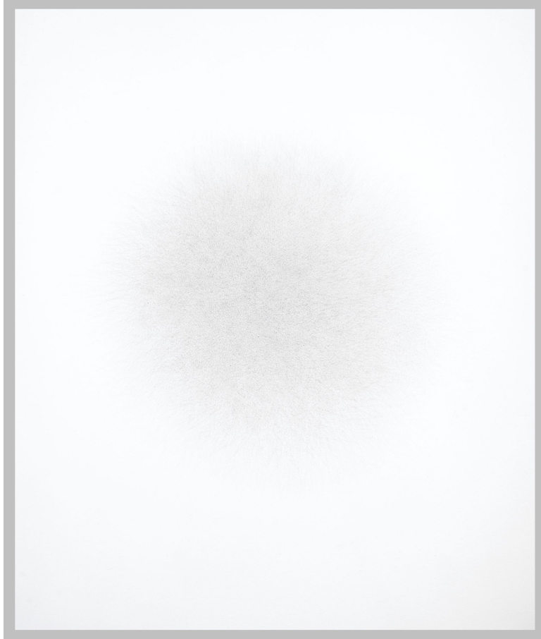
No.2_24/ 2024 / 100x85 cm / Graphite on Canvas

レジーナ・ゼルはドイツ、ミュールハイム・アン・デア・ルール生まれ。クレーフエルトのニーダーライン 応用科学大学でグラフィックを学び、シュトゥットガルトの州立美術アカデミーでルドルフ・スコーフス教授 の下、自由絵画と自由グラフィックアートを学びました。現在、ベルリンにて創作活動を行っています。