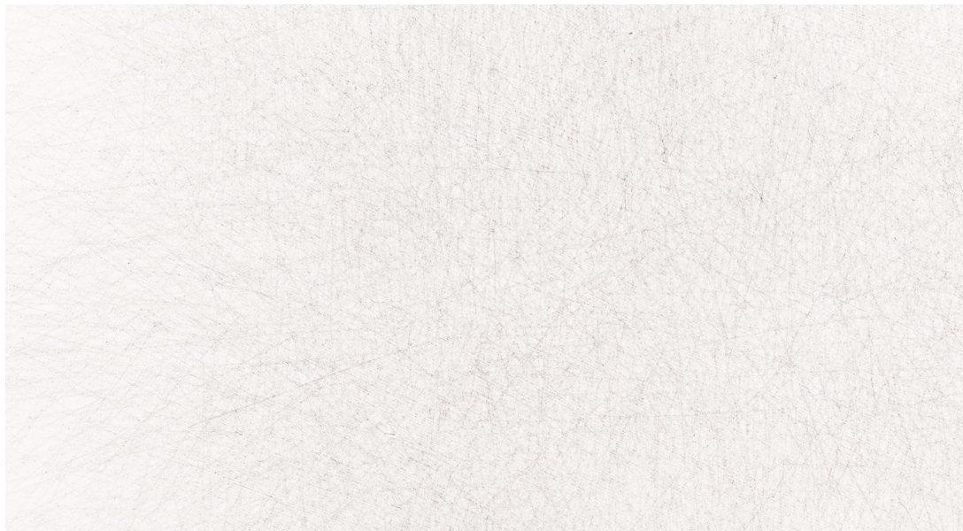
拡大 No.2_23, / 2023 / 65x65 cm / Graphite on Canvas